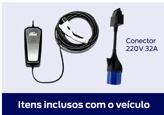
Conector 220V 32A