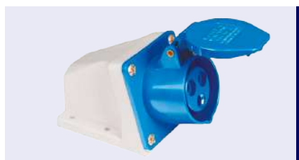
Exemplo de tomada N3206 32A a ser adquirida.

*Informações de referência para dimensionamento de infraestrutura e custos. A instalação deve ser feita por um especialista conforme ABNT NBR 5410 e NBR 17019 .