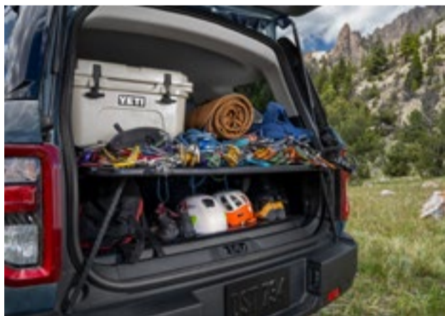
Sistema de gerenciamento de carga com 05 posições diferentes