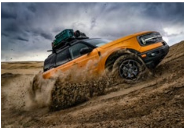
Tração 4x4, diferencial traseiro blocante e vetorização de torque