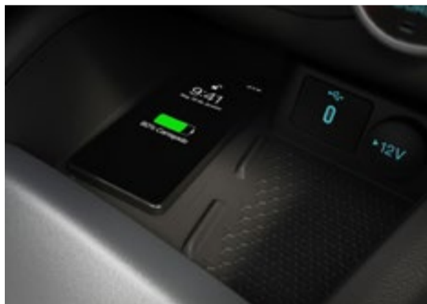
Carregamento de celular por indução