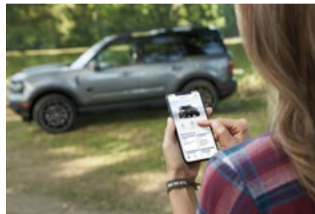
Conectividade via aplicativo Ford Pass™