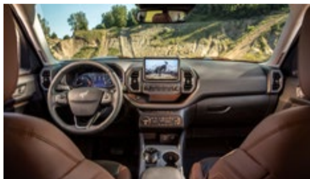
Bancos parcialmente revestidos em couro Ebony / Roast