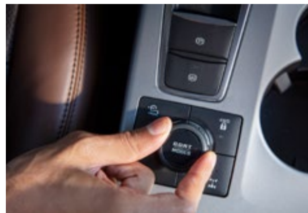
Seletor com 07 tipos de terrenos (G.O.A.T. modes)