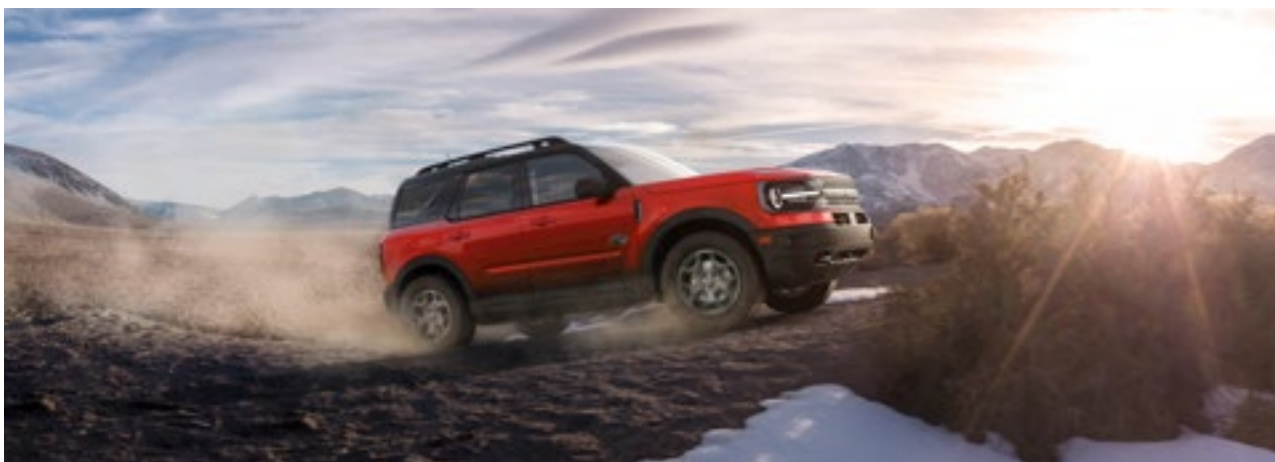
Motor 2.0L EcoBoost com 253 cv de potência e 380 Nm de Torque

9 air bags (frontais, laterais dianteiros, laterais traseiros, cortinas e joelho do motorista) Controle eletrônico de estabilidade (ESC) e tração (TCS) Assistente de manobras evasivas Assistente de partida em rampas (HLA) Aviso de utilização dos cintos de segurança Cintos de segurança dianteiros com ajuste de altura Cintos de segurança traseiros laterais e central de 3 pontos Espelho retrovisor interno eletrocromático Farol alto automático Freios a disco nas 4 rodas Freios ABS com EBD ISOFIX - Ganchos de fixação de cadeiras de crianças Luz elevada de freio (Brake-light) Piloto automático off-road (Trail Control) Protetores inferiores off-road Alerta de colisão com aviso luminoso e sonoro no painel de instrumentos Assistente de frenagem autônoma (AEB) com detecção de pedestre Sistema de monitoramento de ponto cego (BLIS) Assistente de permanência e centralização em faixa TPMS - Sensor de monitoramento de pressão dos pneus