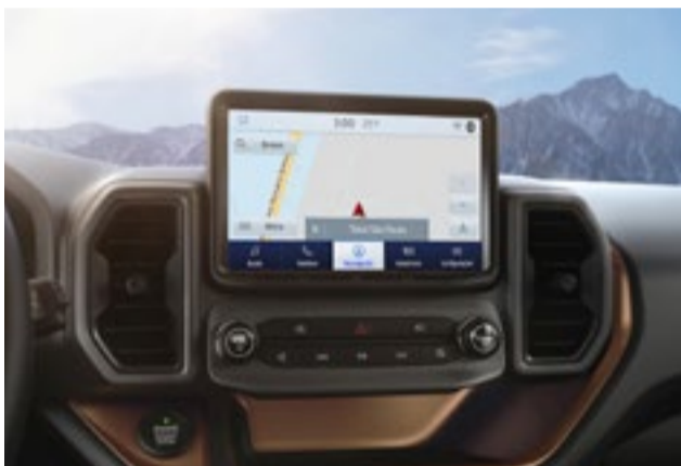
Sync 3 - Compatível com Android Auto e Apple CarPlay