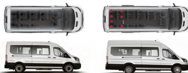
L3H2 versão Minibus com 14+1 lugares e versão Vidrada com 2+1 lugares