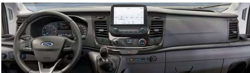
Mais conforto e dirigibilidade em conjunto com o Sync Move