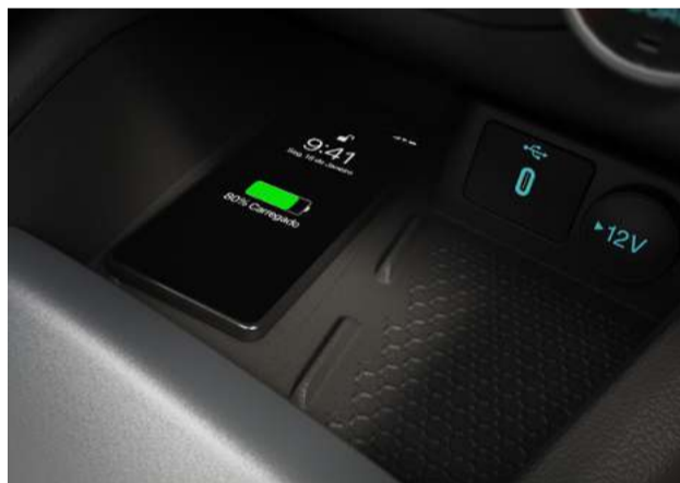
Carregamento de celular por indução