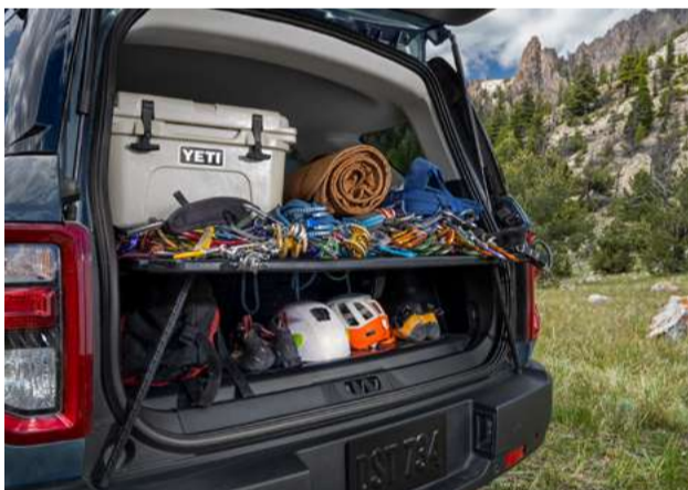
Sistema de gerenciamento de carga com 05 posições diferentes