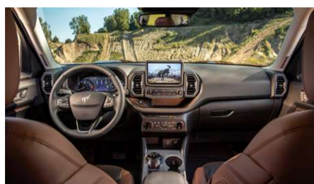
Bancos parcialmente revestidos em couro Ebony / Roast