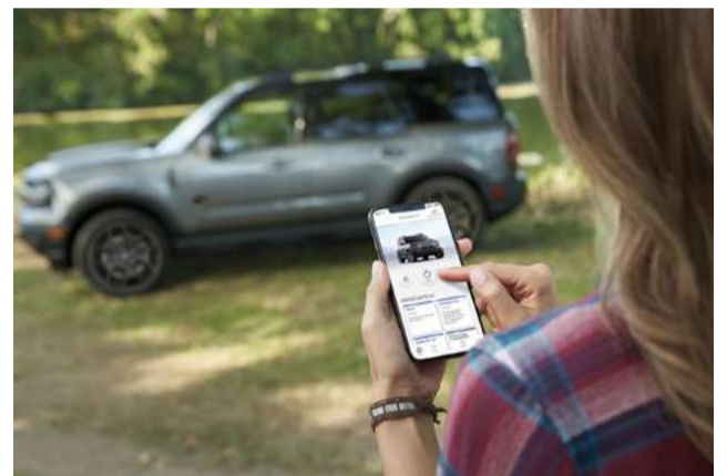
Conectividade via aplicativo Ford Pass™