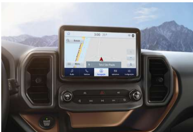
Sync 3 - Compatível com Android Auto e Apple CarPlay