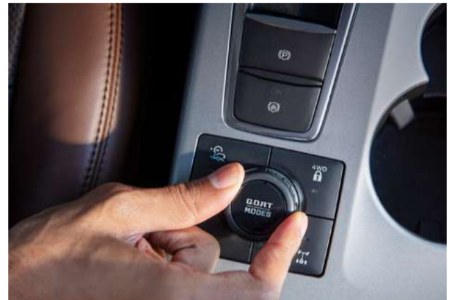
Seletor com 07 tipos de terrenos (G.O.A.T. modes)