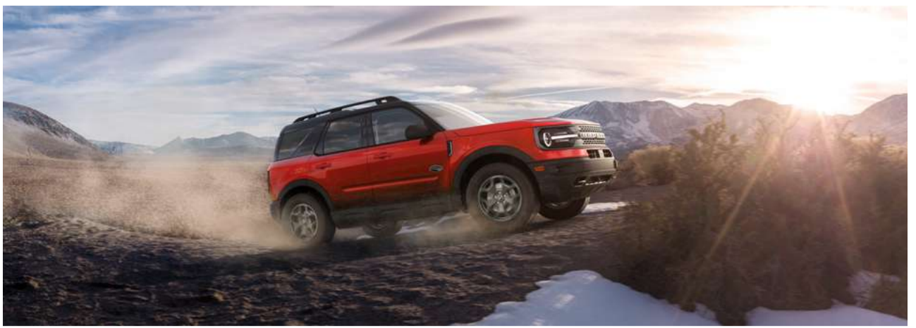
Motor 2.0L EcoBoost com 253 cv de potência e 380 Nm de Torque