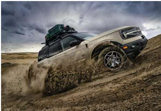
Tração 4x4, diferencial traseiro blocante e vetorização de torque