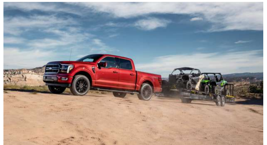
Motor 5.0L V8 de 405 cv e transmissão automática de 10 velocidades, tração 4x4 e rodas de liga leve de 20".

Abertura das portas por código sem chave (Keypad) Ar condicionado automático digital de duas zonas Carregador de celular por Indução Câmeras: frontal, traseira e engate Câmera 360° Chave com sensor de presença: Acesso inteligente e Partida sem chave (Ford Power) Controle de freio para reboque Freio de mão eletrônico Função Auto Hold Heads-up display Painel de Instrumentos digital de 12" Pro Trailer assistente de reboque Sensor de chuva Tomadas de 12V (1) frontal e (1) banco traseiros Tomadas 110v (1) frontal, (1) banco traseiros e (1) caçamba Vidros Elétricos frontal / traseiro Vidros elétricos dianteiros com abertura e fechamento com um toque para cima/baixo