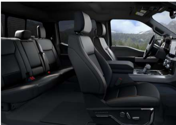
Espaço interno com muito conforto. Ajustes elétricos de pedais, volante e bancos com memória.