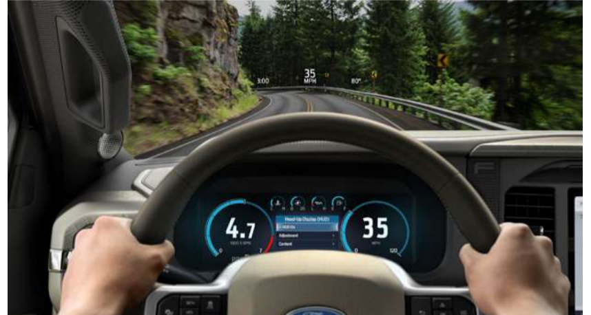
Head up display: tecnologia que projeta as informações do veículo diretamente no parabrisa.