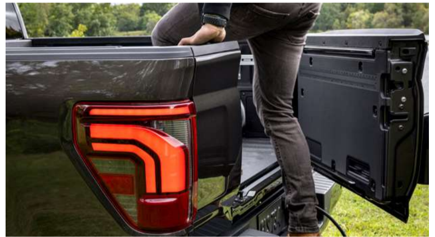
Tampa multiacesso (Pro-Access): acesso e abertura lateral da caçamba.