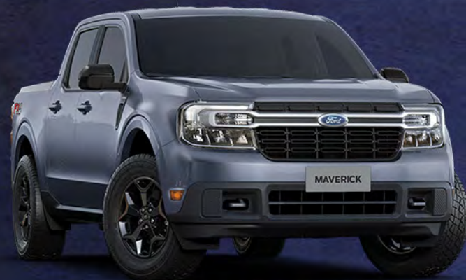
■ PRATA ORVALHO