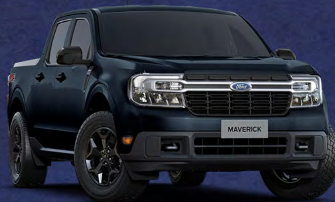
■ PRETO ASTÚRIAS