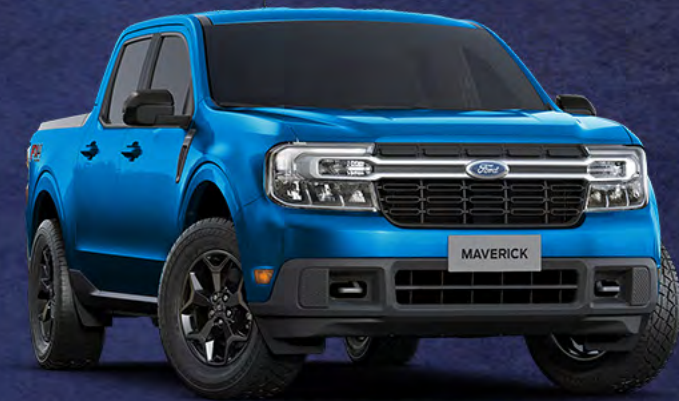
■ AZUL ATLAS