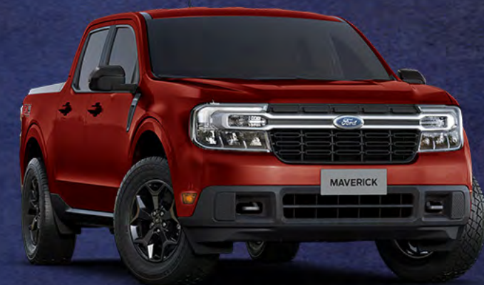
■ VERMELHO AURORA