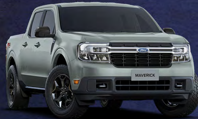
■ CINZA DOVER