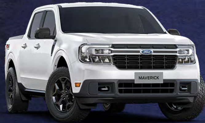
■ BRANCO ÁRTICO