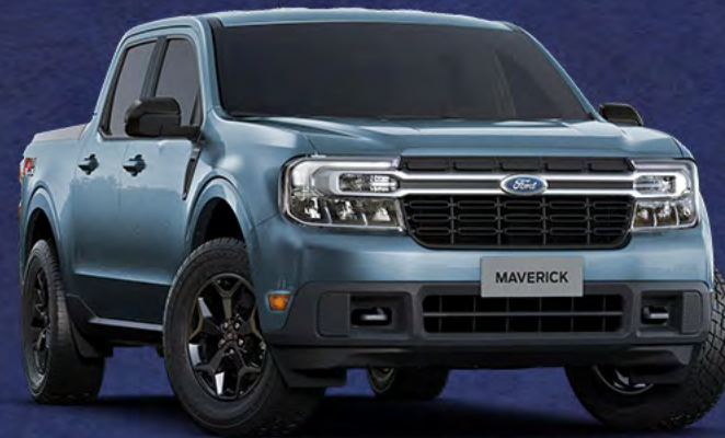
■ CINZA GLASGOW