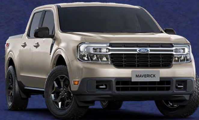
■ BRANCO ITAÚNAS