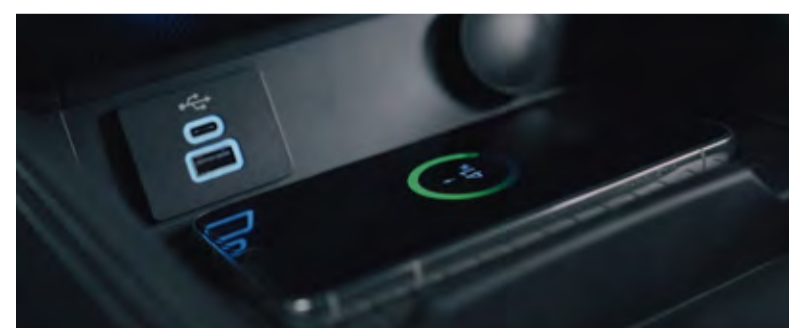
Carregamento de celular por indução