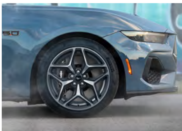
Freios de Alta Performance Brembo®