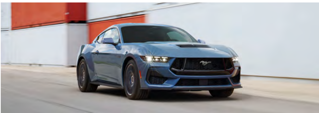
Motor Coyote V8 5.0L

07 Airbags - 02 dianteiros, 02 laterais dianteiros, 02 cortinas e 01 Joelho do passageiro) Alarme de segurança com imobilizador e sensores de inclinação Alerta de colisão frontal Assistente de frenagem autônoma (AEB) com detecção de pedestre / ciclista Assistente de Partida em Rampas (HLA) Assistente de permanência e centralização em faixa Assistente de manobras evasivas Cintos de segurança dianteiros com ajuste de altura e pré-tensionadores Cintos de segurança traseiros de 3 pontos Controle eletrônico de estabilidade (ESC) e tração (TCS) Espelho retrovisor interno eletrocromático Farol Alto Automático Farol Automático Freios a disco nas 4 rodas Freios ABS com EBD ISOFIX - Ganchos de fixação de cadeiras de crianças Luzes de condução diurna (DTRL) Piloto Automático Adaptativo (ACC) com Stop & Go Sensor de monitoramento da pressão dos pneus (TPMS) Sistema de monitoramento de ponto cego (BLIS) com alerta de tráfego cruzado Travamento elétrico das portas