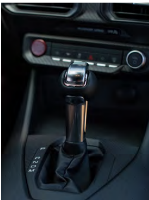
Transmissão automática de 10 velocidades

B&O Premium Sound System by Bang & Olufsen com 11 alto-falantes e 01 subwoofer Bluetooth Comandos de áudio e voz no volante Compatível com Android Auto e Apple CarPlay sem fio Entradas USB tipo A e tipo C GPS Embarcado Tela central multifuncional touch screen de 13.2"