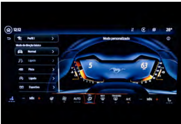
05 modos de condução selecionáveis: Normal, Esportivo, Escorregadio, Pista e Pista Drag.