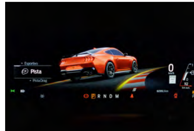
Suspensão Adaptativa MagneRide.