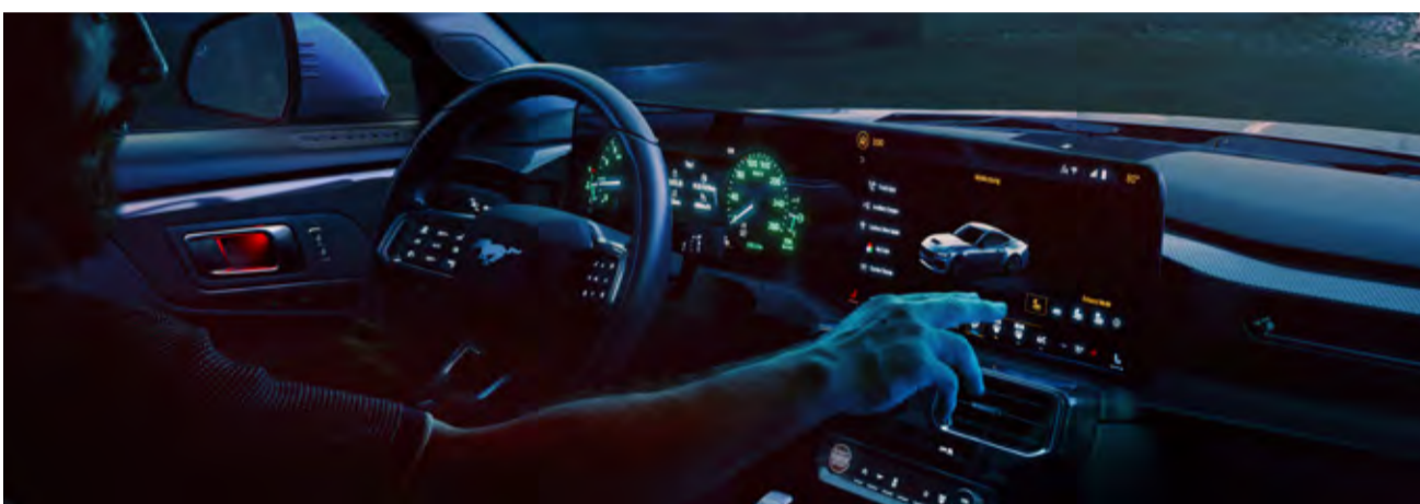
Painel digital e tela touch screen integradas