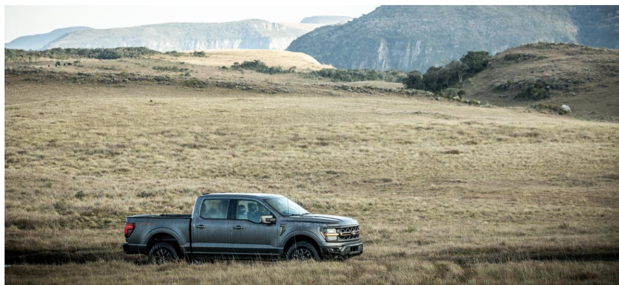
F-150 TREMOR, a picape capaz de atingir um nível inesperado no off-road, pronta para abrir novos caminhos!