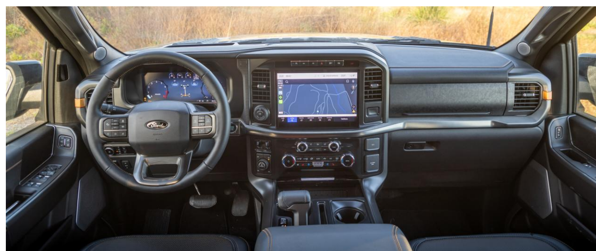
Espaço interno com muito conforto. Ajustes elétricos de pedais, volante e bancos com memória.