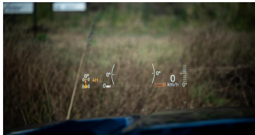
Head up display: tecnologia que projeta as informações do veículo diretamente no parabrisa.