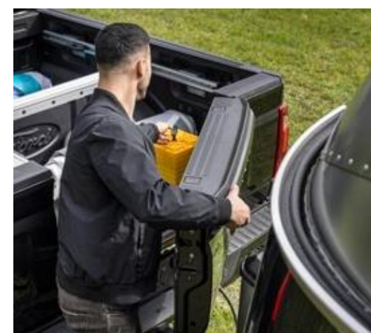
Caçamba revestida com iluminação, tomada 12V, nichos com trava e abertura lateral multiacesso (Pro-Access).