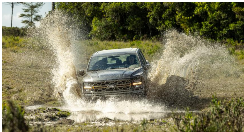
Motor 5.0L V8 de 405 cv e transmissão automática de 10 velocidades e tração 4x4.

Alerta de acionamento do alarme no celular Alertas de funcionamento do veículo Partida remota agendada Partida remota com acionamento do ar condicionado Sistema de localização do veículo no celular Status remoto do veículo (nível do combustível, hodômetro) Travamento e destravamento remoto do veículo